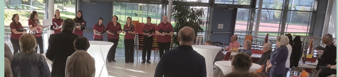
CHORona singt zum Abschied

Ein ganz großes Dankeschön geht auch dieses Mal wieder an alle Quartiergeber in Markgröningen und Umgebung! Sie haben wesentlich dazu beigetragen, dass sich unsere Gäste hier wohlgeföhlt haben und vielfach gesagt oder gedacht haben: „Wir kommen wieder!“