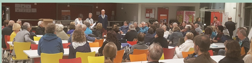
Nach der Ankunft – Gäste werden in Empfang genommen