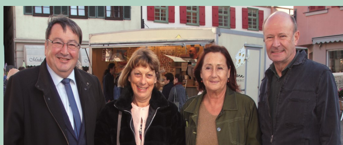
Unsere Bürgermeister – ganz entspannt und ohne Kette!

Ein ganz großes Dankeschön geht auch dieses Mal wieder an alle Quartiergeber in Markgröningen und Umgebung! Sie haben wesentlich dazu beigetragen, dass sich unsere Gäste hier wohlgeföhlt haben und vielfach gesagt oder gedacht haben: „Wir kommen wieder!“