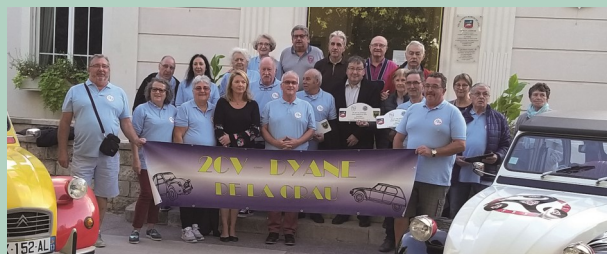
Vor dem Start: Oldtimer am Rathaus von Saint-Martin-de-Crau