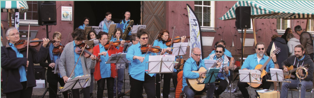
La Malle aux Arts – ein Koffer voll Musik, am Samstag auf dem Markt!