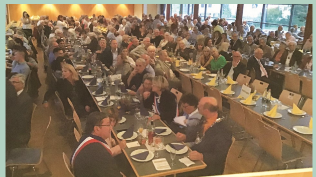
Es wird gefeiert