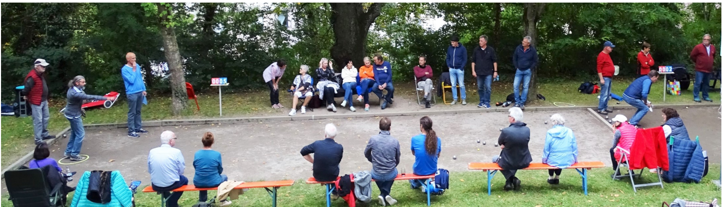
Spannung beim Bouleturnier

Zum Jubiläumsturnier am 29. 9. 2019 folgten erstmals 16 Teams der Einladung des Vereins Städtepartnerschaften Markgröningen. Die weiteste Anreise hatten dabei die Boulespieler aus Saarbrücken, die von einem Freund aus Markgröningen angemeldet wurden. In 4 Gruppen wurden die 8 Teilnehmer für die K.O. - Runde ausgespielt. Bereits in dieser frühen Phase entwickelten sich enge und spannende Partien. Neben den Titelverteidigerinnen schieden auch die anderen Markgröninger Teams leider schon recht früh aus. Somit war der Weg frei für die auswärtigen Teilnehmer.